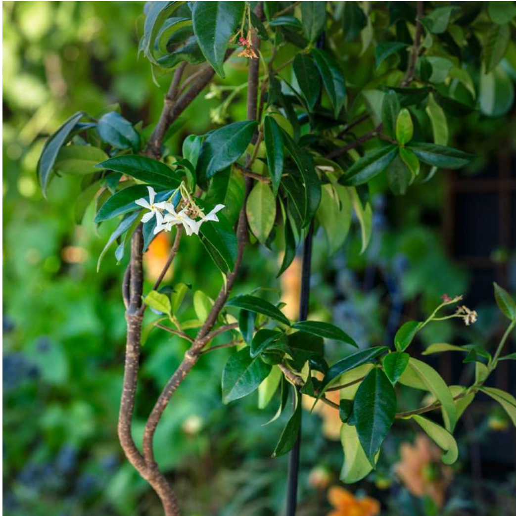
Trachelospermum jasminoides (Star Jasmine)