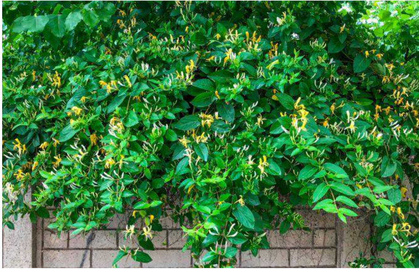
Lonicera Henryi 'Copper Beauty' (Honeysuckle 'Copper Beauty')