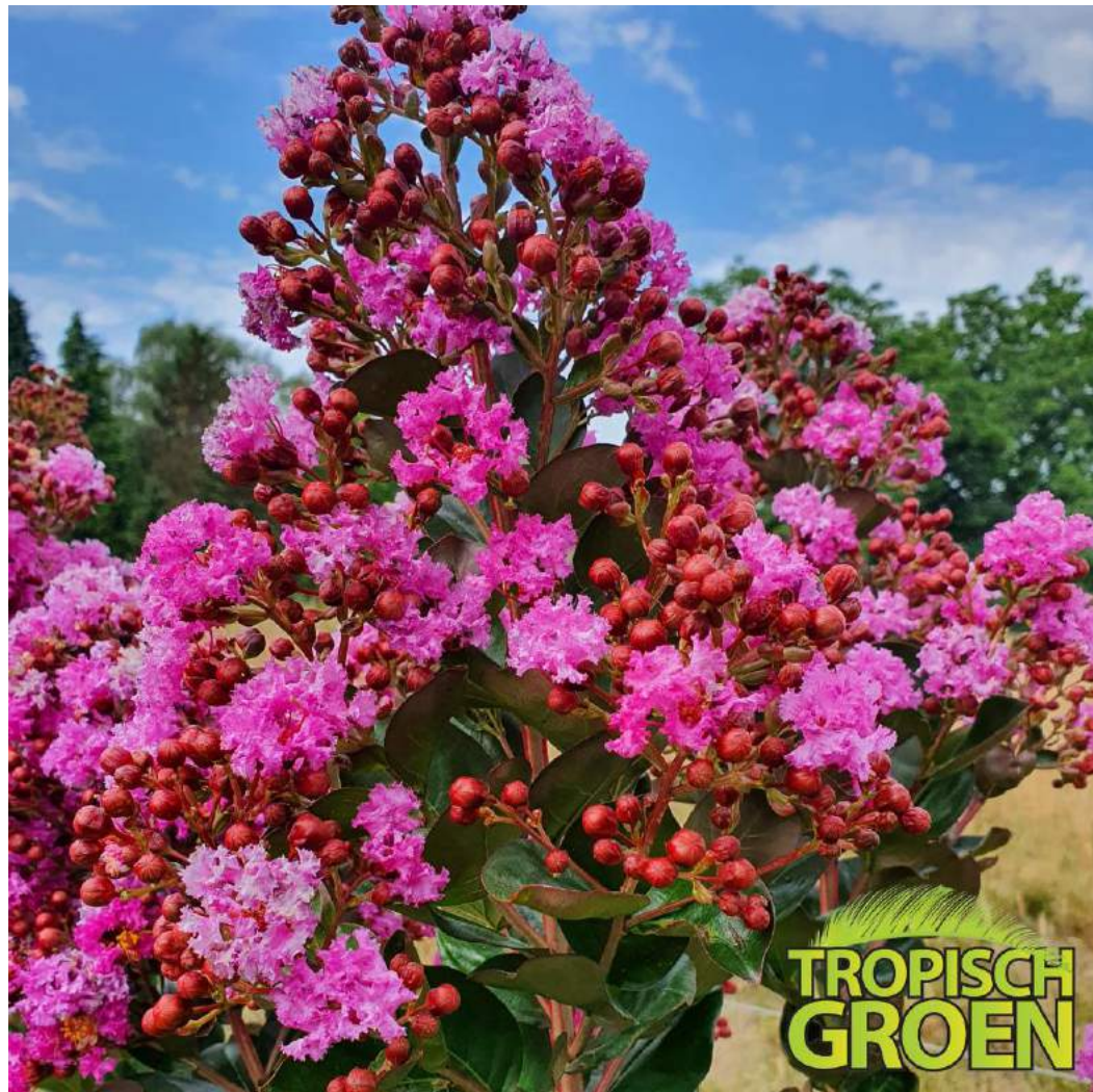
Lagerstroemia indica (Crape Myrtle)