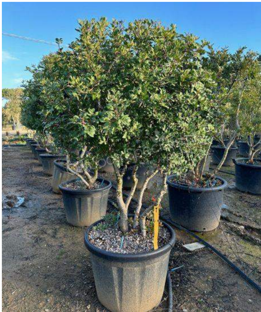
Pistacia lentiscus (Mastic Tree)