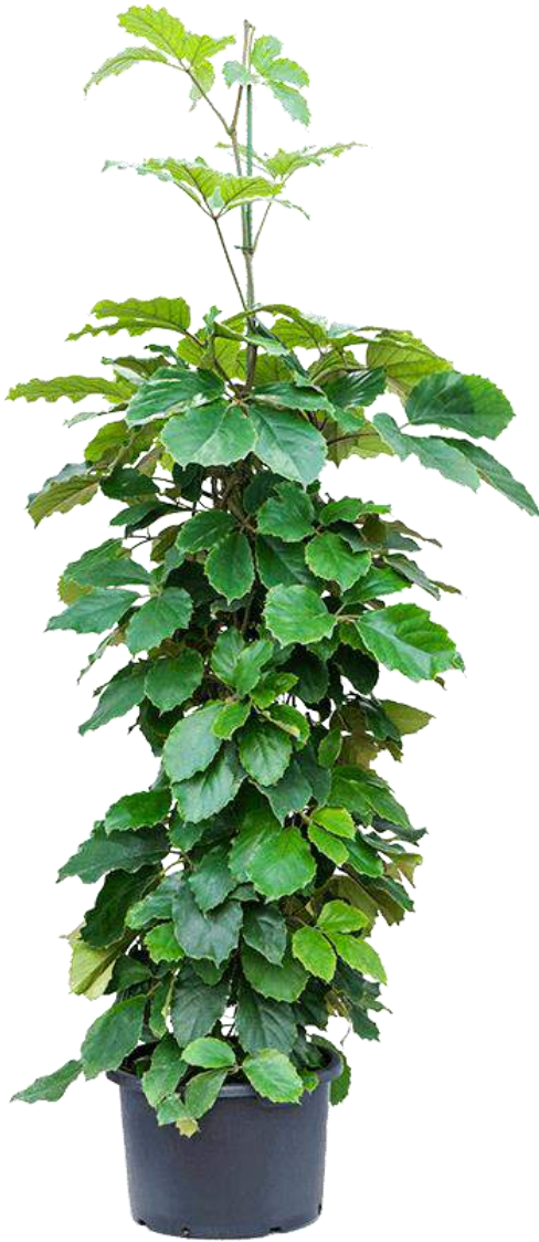
Tetrastigma voinierianum (=hangend)